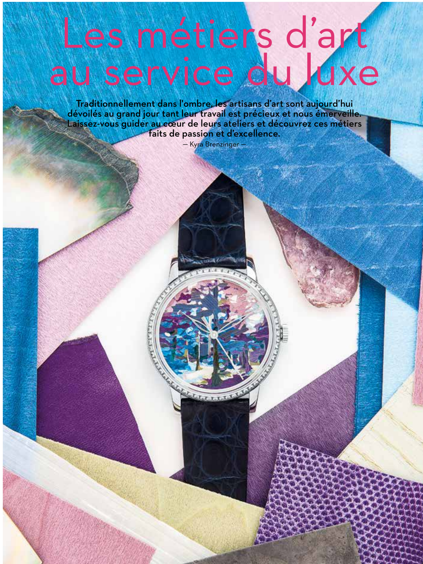
Création Rose Saneuil, montre Forêt, en marqueterie de sycamore, tulipier, érable moucheté, platane maillé, loupe de noyer, frêne, loupe de madrona, nacre blanche, nacre noire Tahiti, paille, parchemin, élytre de scarabée, cuirs (agneau, veau, serpent), mica, plume de coq.