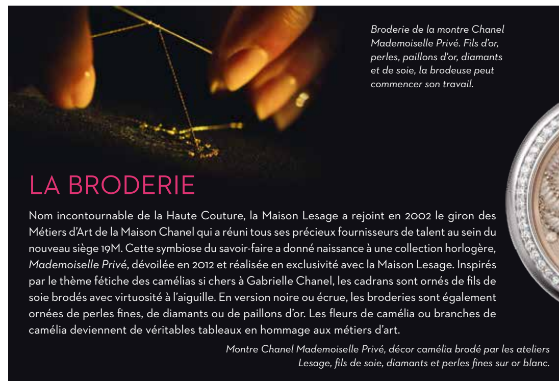
Broderie de la montre Chanel Mademoiselle Privé. Fils d'or, perles, paillons d'or, diamants et de soie, la brodeuse peut commencer son travail.