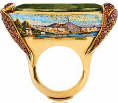
Le Sibille, bague Vesuvo, en micromosaïque, rubis, saphirs, diamants bruns, prasiolite sur or jaune.