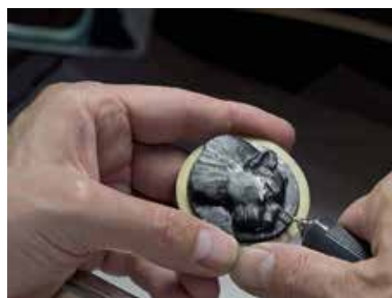
Cartier, sculpture d'un pendentif type camée en jaspe zébré de Madagascar, créée et réalisée dans l'atelier Glyptique de la Maison Cartier.