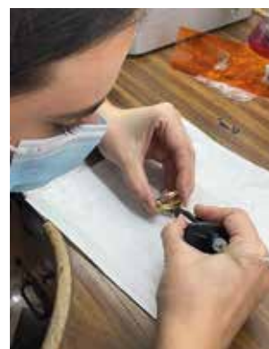
Dans les ateliers de Mathon Paris, la pose de la laque sur la bague chêne demande une belle maîtrise du trait.