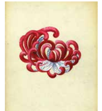
Van Cleef & Arpels, dessin représentant un clip Chrysanthème en Serti Mystérieux de 1937.