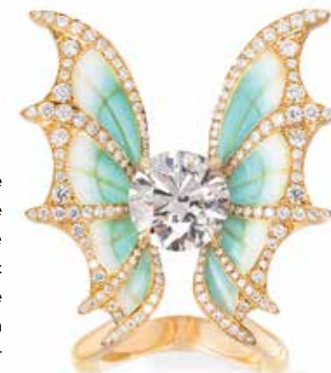
Vever, bague Nuit Magique, ornée d'émail plique-à-jour réalisé par Sandrine Tessier.