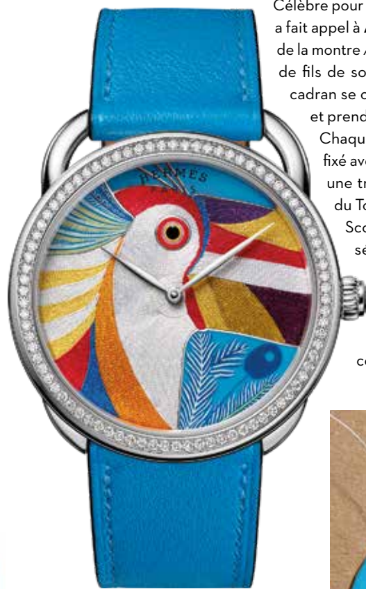
Hermès, montre Arceau Toucan de Paradis, avec le cadran en fils de soie et émail miniature sur or gris, lunette sertie de diamants, bracelet veau bleu.

Pour la réalisation de la montre Hermès Arceau Toucan de Paradis, l'artisan Agnès Paul-Depasse a assemblé près de 500 fils de soie pour réaliser un cadran en une semaine.