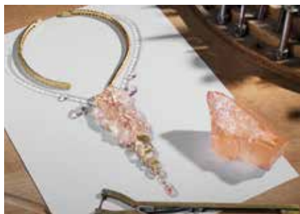
Cartier, collier de Haute joaillerie, morganite sculptée, spinelles taille briolette ; créé et réalisé dans l'atelier Glyptique de la Maison Cartier.