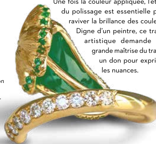
Mathon Paris, bague Chêne, de la collection Les Vergers, laque, diamants sur or jaune.

étape à la lampe aux rayons ultraviolets. Une fois la couleur appliquée, l'étape du polissage est essentielle pour raviver la brillance des couleurs. Digne d'un peintre, ce travail artistique demande une grande maîtrise du trait et un don pour exprimer les nuances.